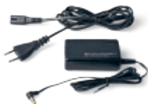
Stromkabel und Netzteil